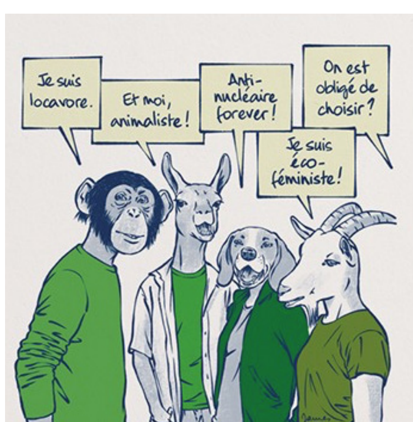
Quel écolo êtes-vous ?