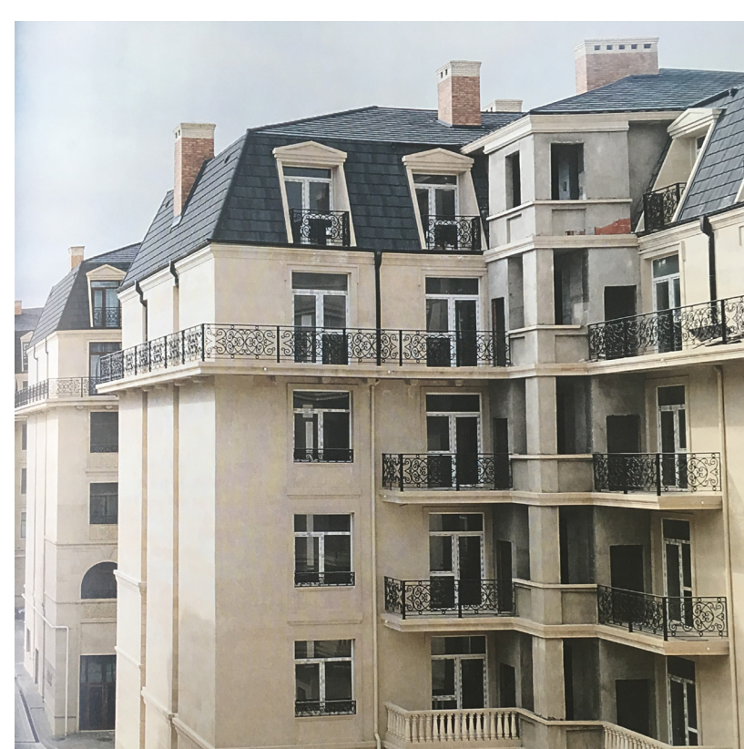
Hausmann en Azerbaïdjan