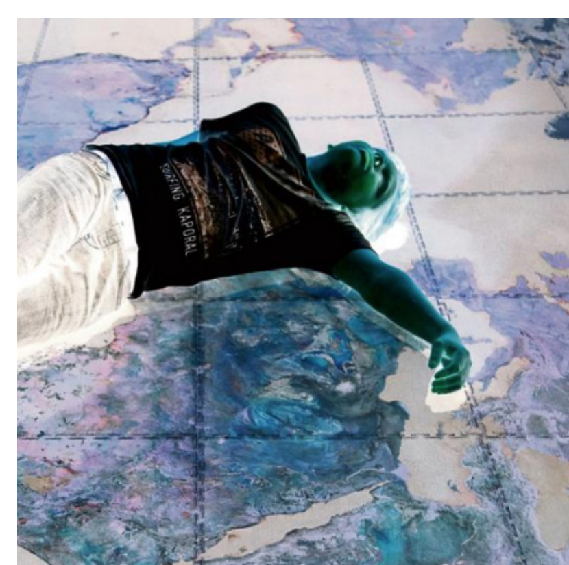
Mal de terre

Par Audrey Garric et Pascale Krémer Le Monde n°23156 «L'Epoque», p. 1-4