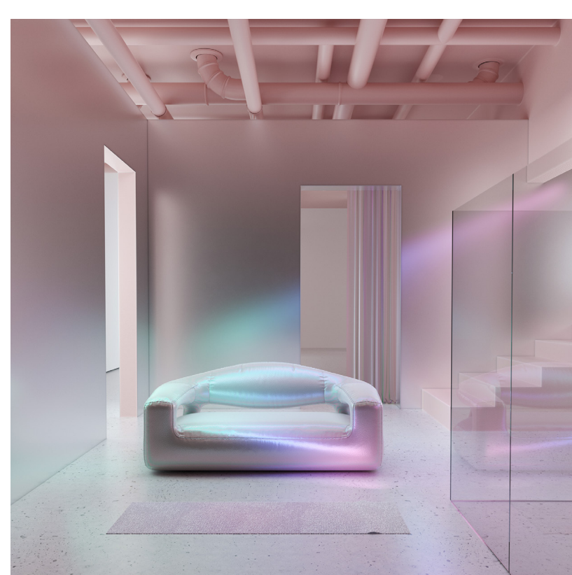
Six N Five